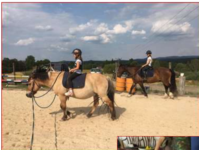
Jezdecký výcvik (LPT ve Stanovicích)