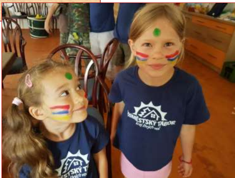
Z LPT v Ovesných Kladrubech