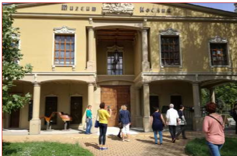
Z návštěvy Muzea kočárů v Čechách pod Kosířem