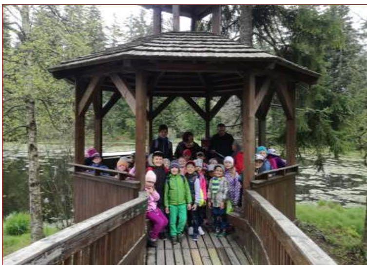
Implementace MAP II – Exkurze ve Slavkovském lese pro žáky MŠ a ZŠ