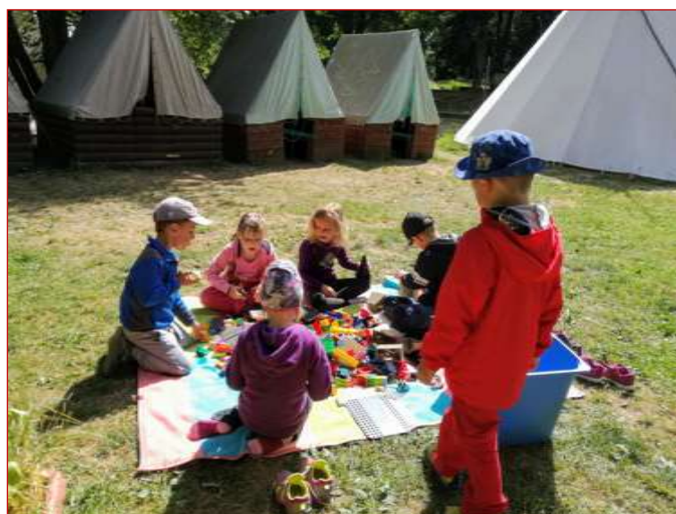
Kreativní aktivity (LPT v Bečovské botanické zahradě)

Celkem v roce 2019 proběhlo 7 turnusů za účasti 126 dětí.