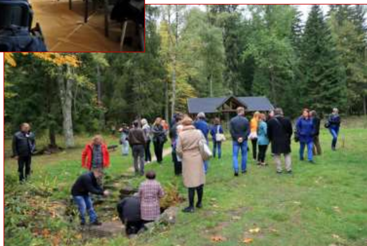
Exkurze účastníků konference – zastávka v obci Prameny