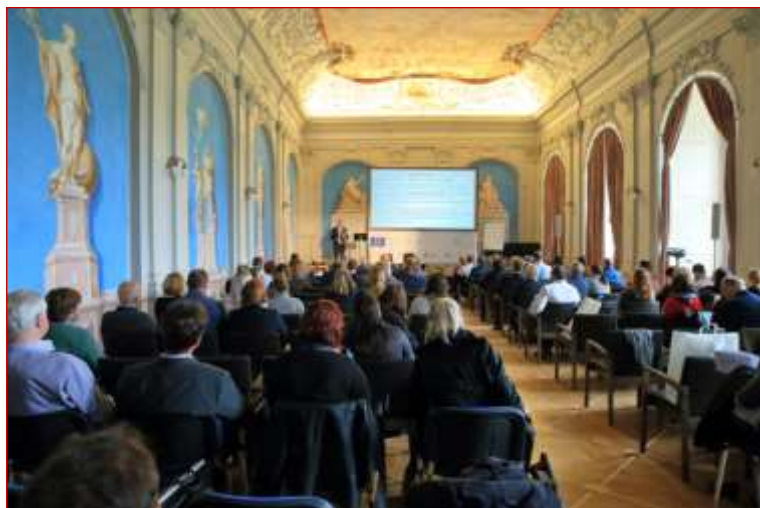
Zasedání Národní konference Venkov 2019 v Modrém sále kláštera premonstrátů v Teplé