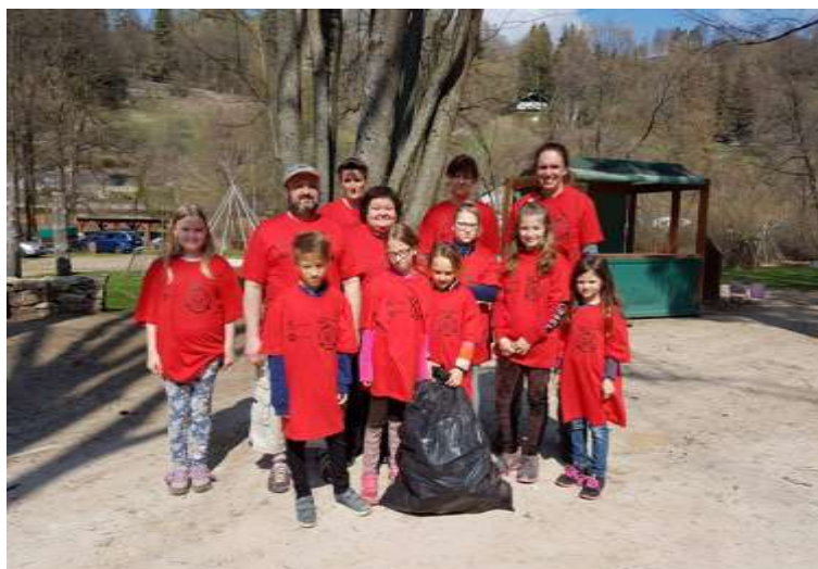
Čištění řeky Teplé v Bečově