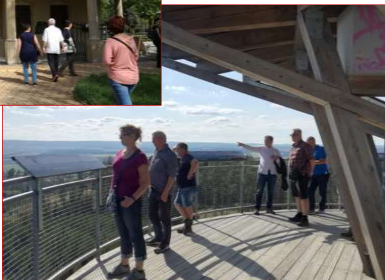
Rozhledna na Kosíři